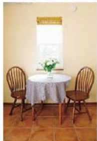
ほっと安らぐ空間