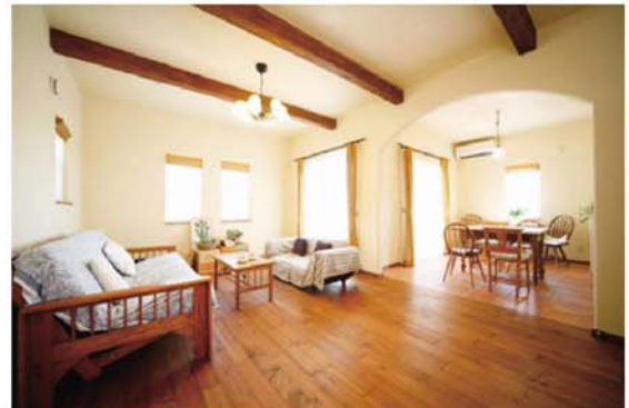
厚さ28ミリの赤松ムクフローリングの感触に心なごむリビング