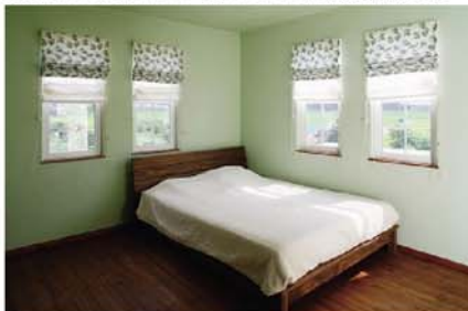
景色を絵画のように眺められる窓