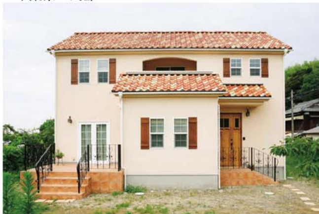
スタッコラーストの塗り壁とS瓦がプロヴァンスの伝統的な趣き